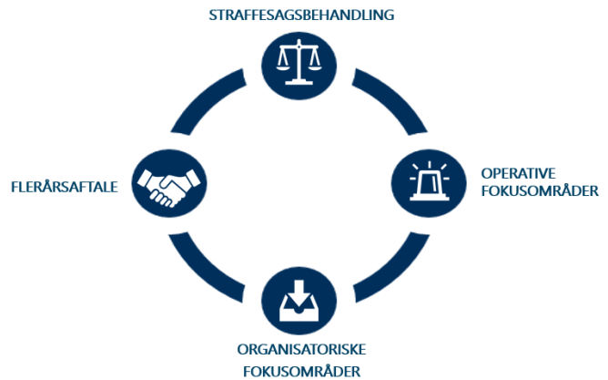
MÅL OG FOKUS 2022

Disse mål og fokusområder er enten centralt fastsatte af Rigspolitiet og Rigsadvokaten eller lokale mål, der skal bidrage til fortsat udvikling af kredsen. Hertil vil den fortsatte implementering af flerårsaftalen også være en naturlig del af Bornholms Politis fokus.