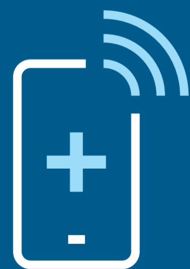
Ved behov for lægehjælp, så ring i forvejen. Mød ikke op uden en aftale

Læs vores pjece på hjemmesiden sst.dk/covid-turist