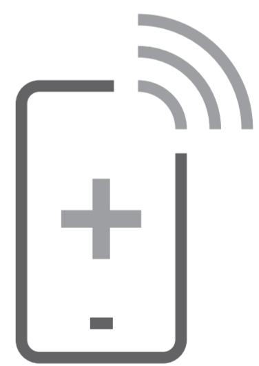
Ved behov for lægehjælp, så ring i forvejen. Mød ikke op uden en aftale

Læs vores pjece på hjemmesiden sst.dk/covid-turist