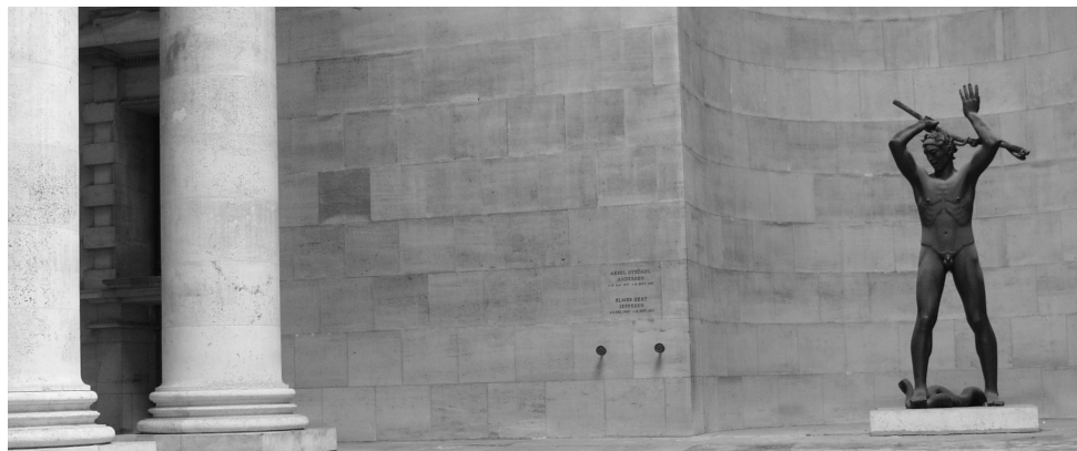
I Mindegårdens centrale niche står kunstneren Ejnar Utzon-Franks bronzestatue "Slangedræberen". Statuen var udstillet på Den Frie Udstilling og blev købt til Politigården i 1925.

I midten af gulvet, i såvel den runde som den firkantede gård, ses stjernemotivet igen tydeligt, idet stjernerne begge steder skjuler afløbet for regnvandet.