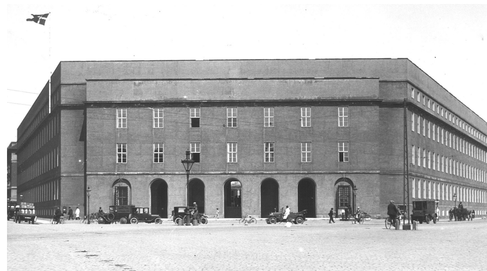
Politigården fotograferet fra Politortorvet i slutningen af 1920'erne.

Til venstre ses første etape af Glyptoteket og umiddelbart til højre herfor ses tømmergraven/vandbassinet, hvor Politigården 20 år senere skulle blive opført. I bunden af billedet ses Tivoli, hvor man kan genkende Tivolisøen og Glassalen.