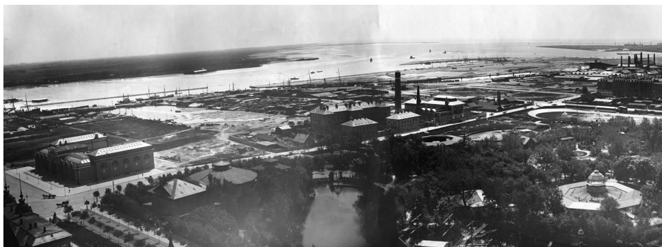
Fotografi fra 1898 taget fra Rådhusstårnet på Københavns Rådhus.

Til venstre ses første etape af Glyptoteket og umiddelbart til højre herfor ses tømmergraven/vandbassinet, hvor Politigården 20 år senere skulle blive opført. I bunden af billedet ses Tivoli, hvor man kan genkende Tivolisøen og Glassalen.