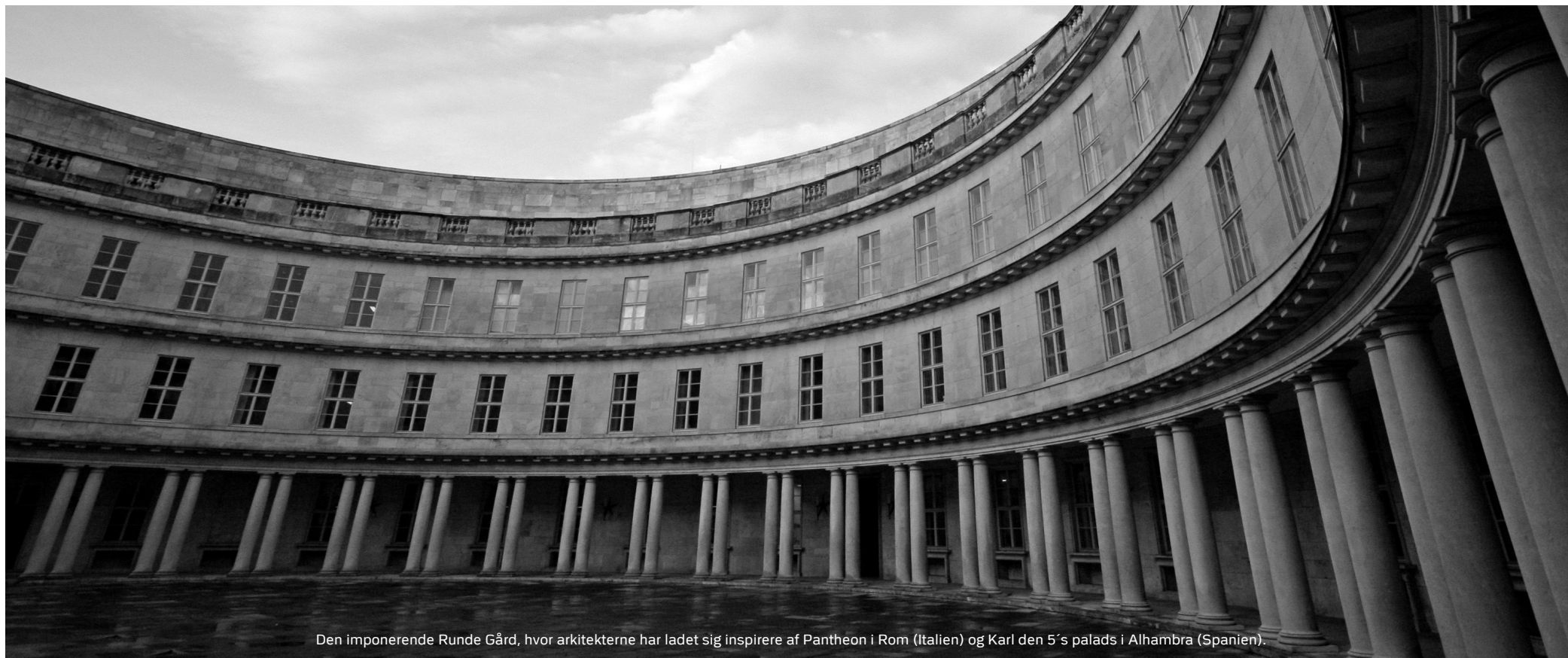
Den imponerende Runde Gård, hvor arkitekterne har ladet sig inspirere af Pantheon i Rom (Italien) og Karl den 5's palads i Alhambra (Spanien).