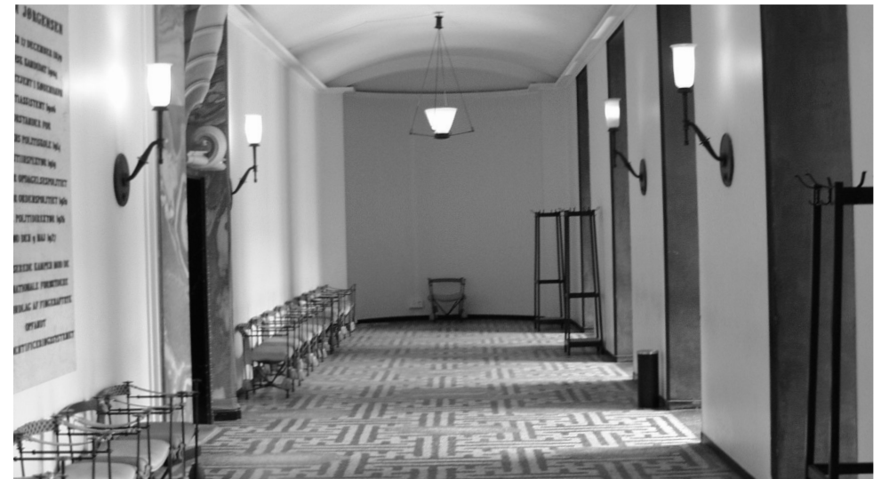
Forhallen ved politidirektørens kontor og parolesalen.

Den daværende kongelige bronzestøber Rasmussen har ud fra Rafns tegninger skabt lamperne, der alle er udført i bronze. Han har desuden skabt gelændere, hvor vægterarmen går igen som motiv, samt stole og bordstillet til bordet i parolesalen.