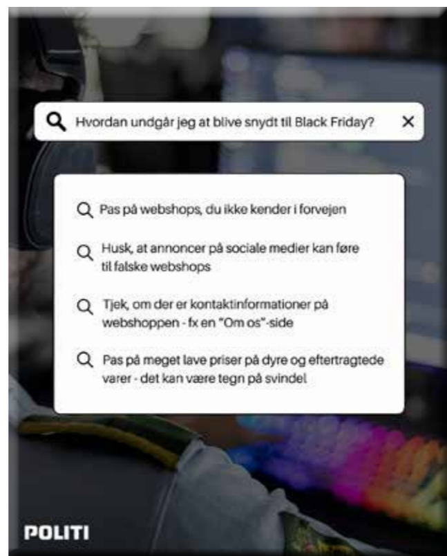
I 2024 vil Københavns Politi fortsætte arbejdet med forebyggende indsatser vedr. økonomisk kriminalitet via sociale medier - herover en advarsel i forbindelse med Black Friday 2023

I 2024 vil Københavns Politi fortsætte arbejdet med forebyggende indsatser vedr. økonomisk kriminalitet via bl.a. sociale medier samt via en aktiv dialogorienteret indsats på fx plejehjem eller skoler, da vi desværre ser, at det ofte er unge og ældre borgere, der fylder i kriminalitetsstatistikken. Dette har til formål at oplyse borgerne, således at borgerne er bedre rustet til at undgå at blive udsat for, eller involveret i, økonomisk kriminalitet.