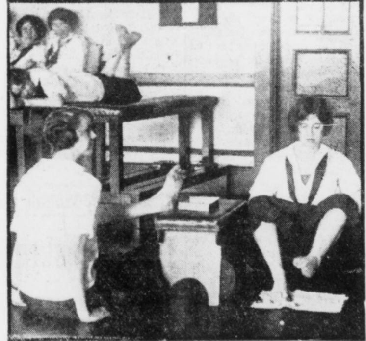
Det gælder om at tage en Genstand op med Tærerne og lægge den i Æsken.

I det store amerikanske Kvindeuniversitet Wellesley lader man nu ogsaa Studierne gøre Gymnastik med Tærerne. Det vil sige, man har fundet paa en Række Taa Øvelser, der gaar ud paa at udvikle Tærernes Bøjelighed, saa man kan bruge dem ligesom man bruger Fingrene. En af disse Øvelser illustreres paa