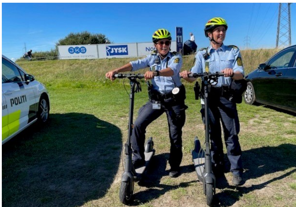
Klar til golfturneringen "Made in HimmerLand" i september 2022

Dette lokale samarbejde knytter sig ikke mindst til en bred vifte af forebyggende indsatser, hvor bilag 1 beskriver nogle af de centrale samarbejdsfora i Nordjylland.