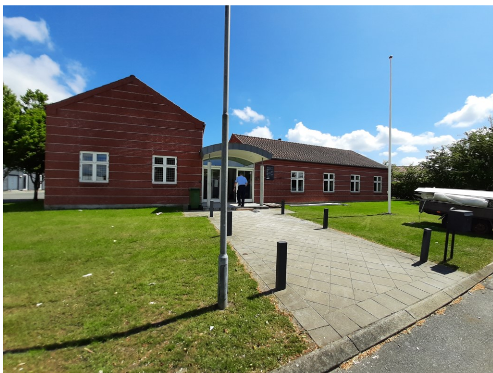
Nærstation Vesthimmerland i Aars