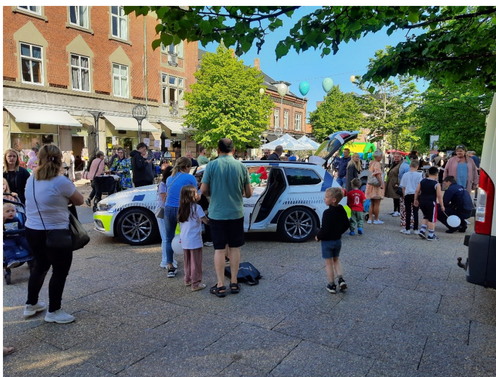
Lokalpolitiet på gaden ved Kulturmaten, en årlig byfest i Hjørring, juni 2023

Dette lokale samarbejde knytter sig ikke mindst til en bred vifte af forebyggende indsatser, hvor bilag 1 beskriver nogle af de centrale samarbejdsfora i Nordjylland.