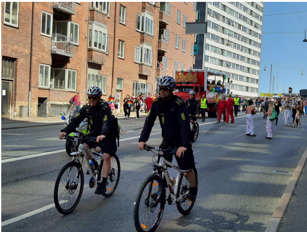
Cyklende patrulje under Aalborg Karneval i maj 2023

Ud fra det aktuelle situationsbillede forberedes og iværksættes med afsæt i dette samarbejde tiltag, som bl.a. knytter sig til forsyningsikkerheden og sikkerhedssituationen generelt i Nordjylland. Samarbejdet har særdeles høj prioritet, og det må forventes at fortsætte – og om nødvendigt at skulle udbygges – i 2024, hvor samarbejdet omkring den sikkerheds- og forsyningsmæssige situation også vil blive drøftet i kredsrådet.