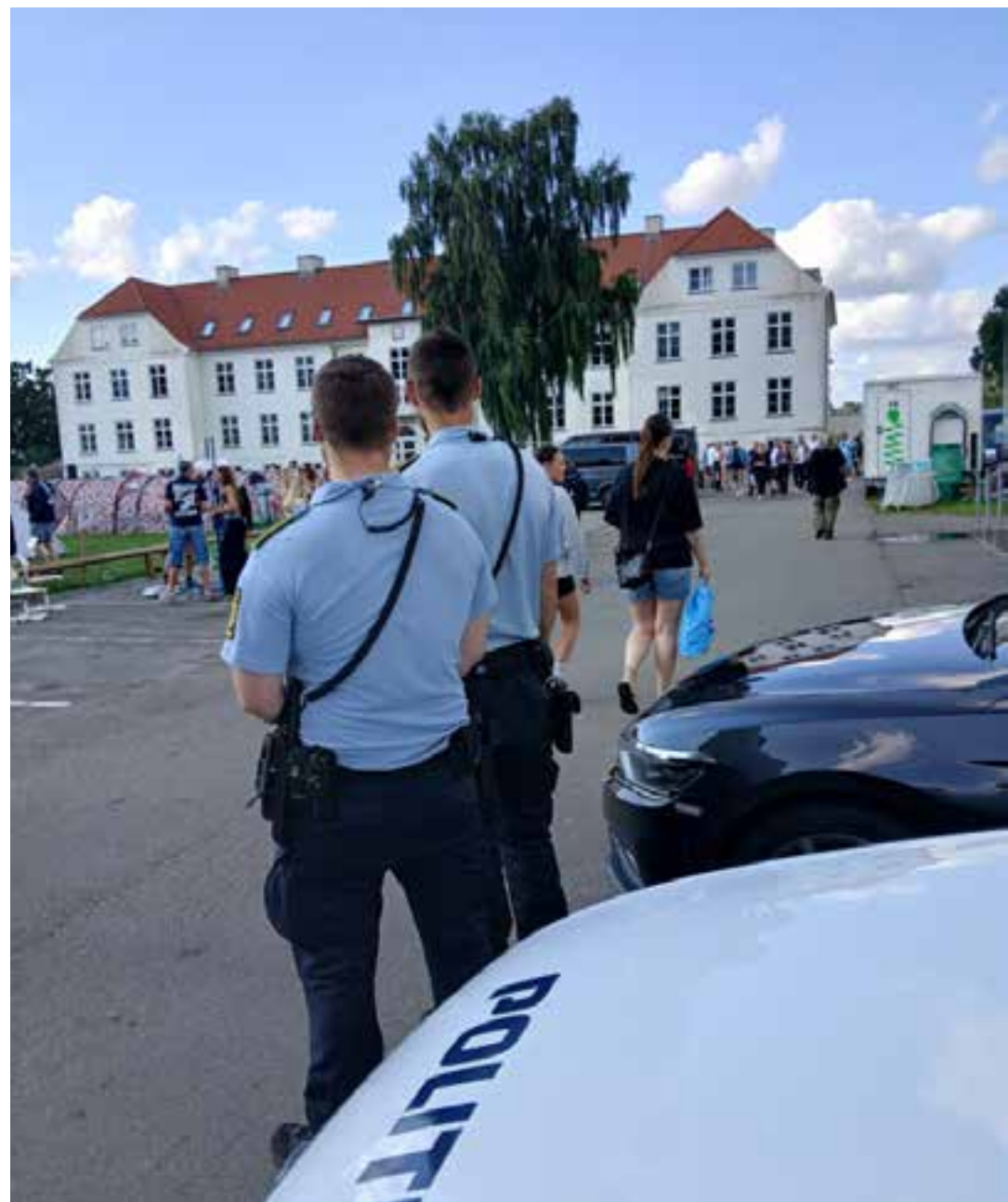
Patrulje til Smukfest i Skanderborg (10. august 2025)

Kilde: Rigspolitiets QlikView-rapport "Låst Responstid". Data trukket den 10. februar 2026.