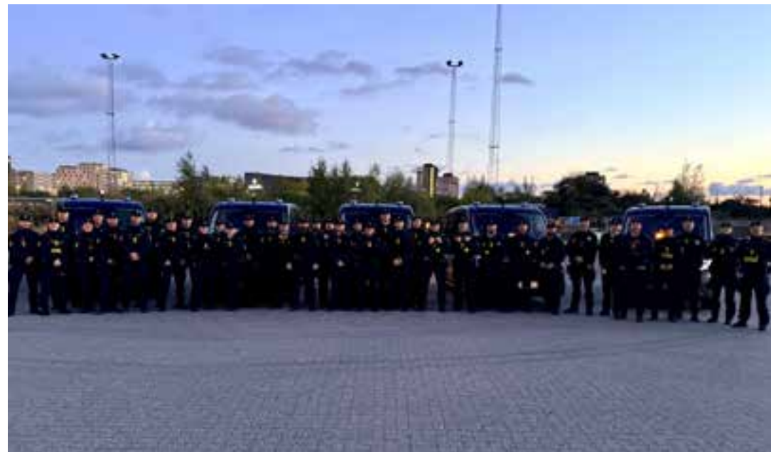
Sydøstjyllands Politi mødte talstærkt op til EU-topmøder i København (3. oktober 2025)

Sydøstjyllands Politi assisterede også ved flere lejligheder landets øvrige kredse, fx ved åbningsarrangementet i Aarhus og ved de store topmøder i København i uge 40. Formandskabet kom også til Sydøstjylland, da der blev holdt EU-møder i Horsens i uge 41 og 42. Alle dagene forløb som planlagt og i god ro og orden.