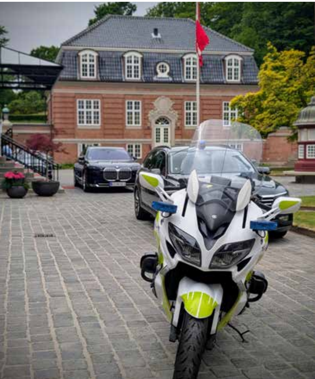
Mike-Lima-øvelse i eskortekørsel (21. maj 2025)