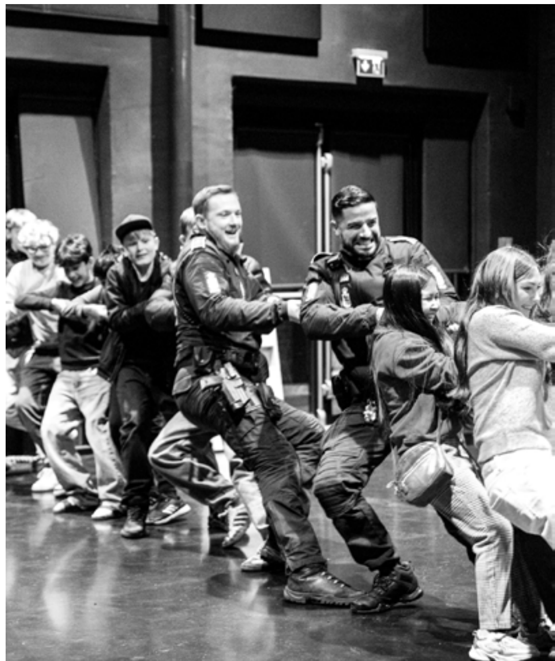
Patrulje til indvielse af ungdomsklub i Grindsted (20. januar 2025)