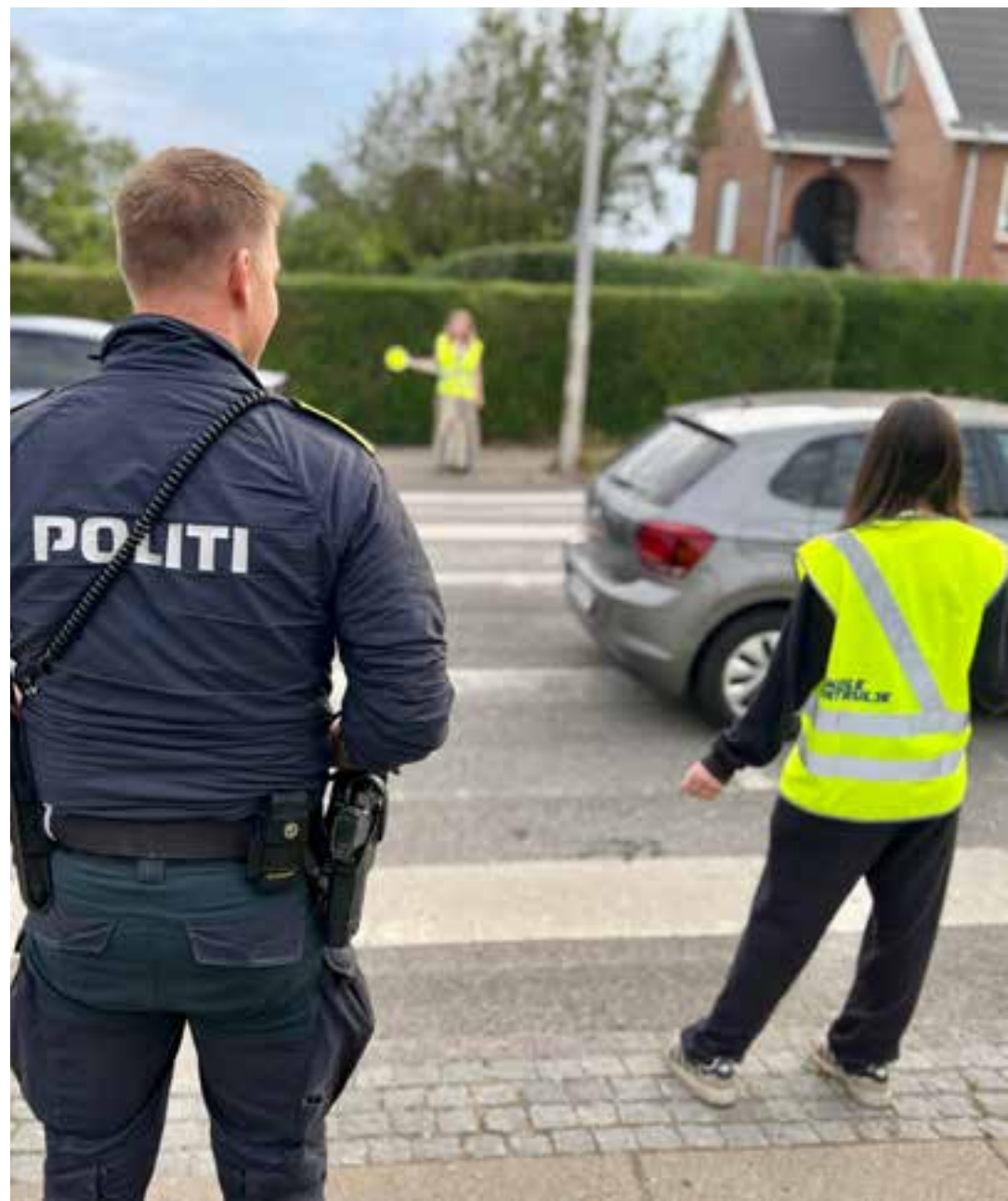
På besøg hos skolepatruljen på første skoledag i Horsens (14. august 2025)

Den 19. september 2025 var det 81 år siden, at Operation Möwe blev igangsat – en koordineret landsdækkende aktion, hvor den tyske besættelsesmagt slog til mod politiet og grænsegendarmeriet. Omkring 2.000 politifolk og 140 gendarmere blev deporteret til tyske koncentrations- og krigsfangelejre, hvor mange mistede livet.