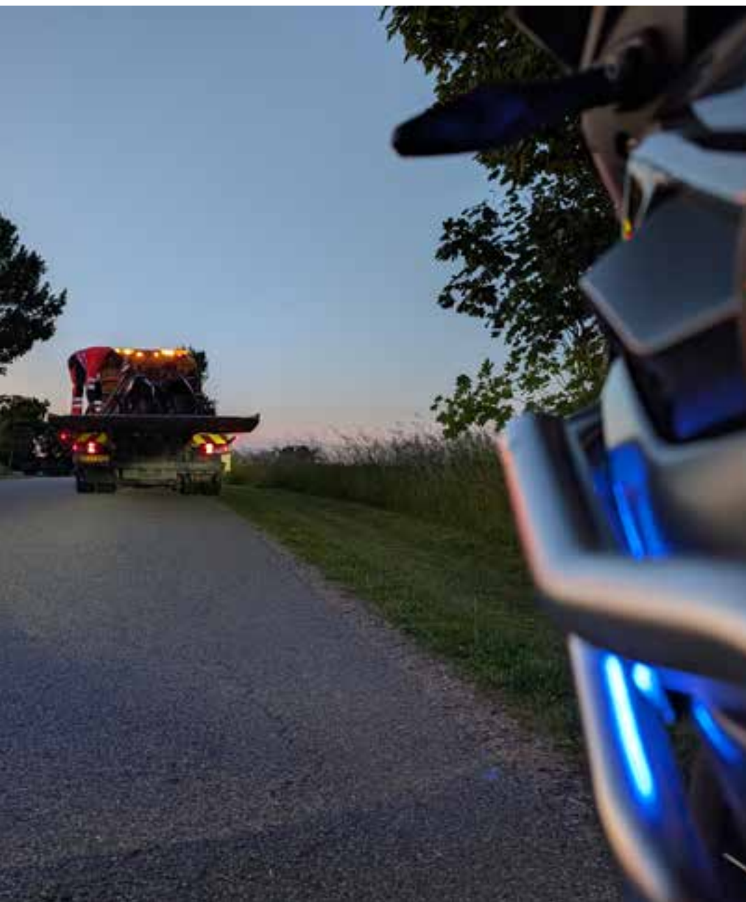
Fejlblad henter knallerter i forbindelse med en færdselskontrol (12. juni 2025)