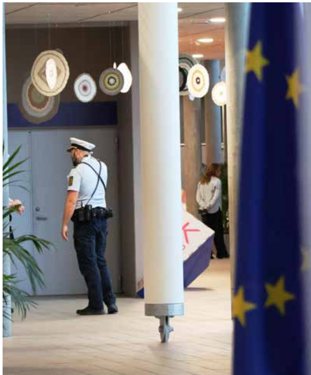
Betjent i forbindelse med EU-møde i Horsens (14. oktober 2025)

For at styrke koordinering, faglighed og fælles løsninger har Sydøstjyllands Politi i 2025 etableret en særlig psykisk sårbar stab, som fungerer på operationelt og koordinerende niveau. Formålet er, at der på tværs af afdelinger og i samarbejde med andre myndigheder bliver kigget på fælles arbejdsmetoder og skabt løsninger, der virker i både akutte situationer og i de forebyggende indsatser.