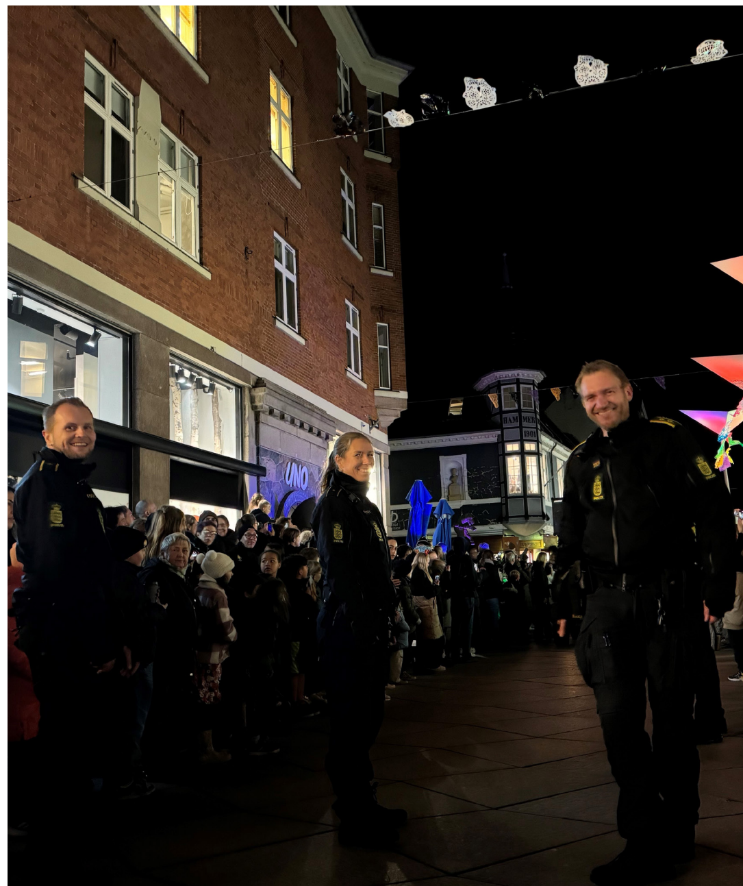
Patrulje til halloween-optog i forbindelse med Vejle By Night (1. november 2024)