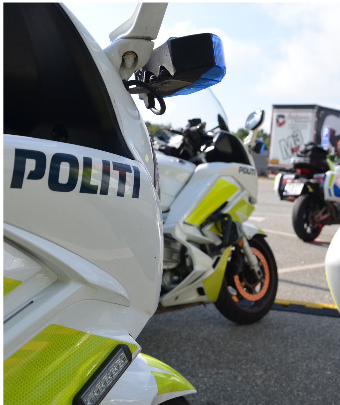
Politimotorcykler til multikontrol (17. september 2024)