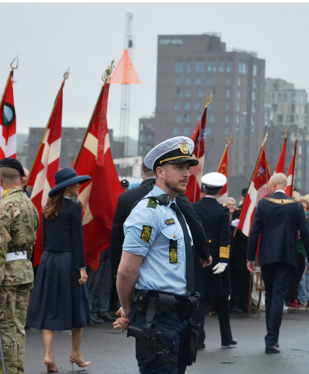
Sydøstjyllands Politi var på plads, da Kongeparret besøgte i Vejle (22. august 2024)