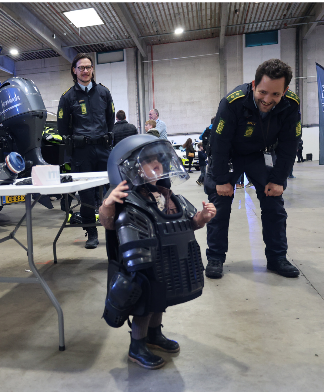
Action24-messe i anledning af Danmarks 75 års medlemskab i NATO (20. april 2024)