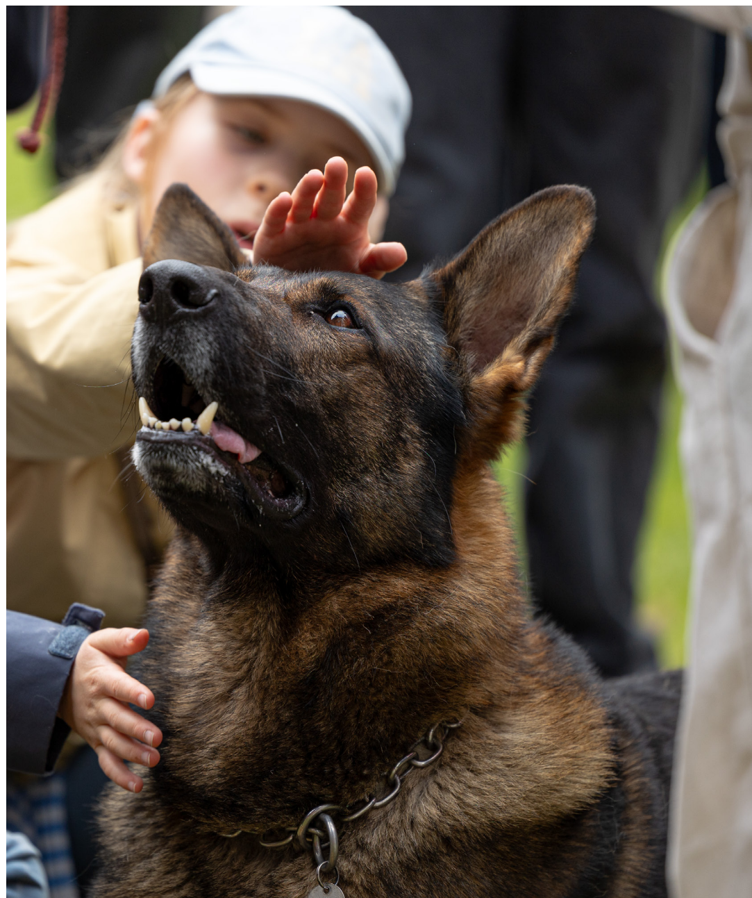
Politihund til åbent hus på Politiskolen i Vejle (4. maj 2024)

Ved kontrollen fandt Toldstyrelsen flere pakker med amfetamin hos en kurervirksomhed i Trekantområdet. Pakkerne, der var vakuumpakkede og