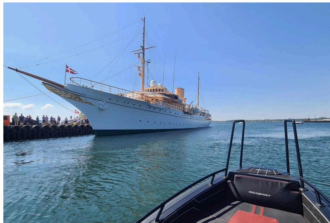
Marsikpol bevogter Kongeskibet Dannebrog til Royal Run i Fredericia (24. maj 2024)

Alle forhold blev begået i perioden fra oktober 2022 til august 2023.