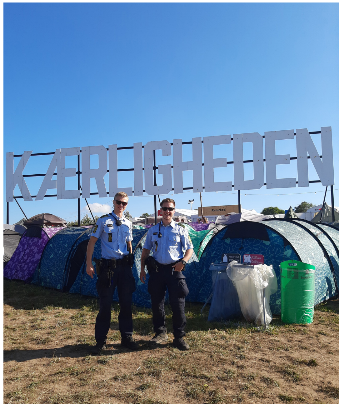
Patrulje på Smukfest i Skanderborg (6. august 2024)

I samarbejde med kommuner og regioner har Sydøstjyllands Politi både i 2024 og fremadrettet et stort fokus på at gøre mest muligt for, at hjælpe borgere med psykiske udfordringer og formindske antallet af tvangsindlæggelser i kredsen.