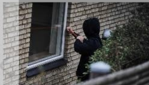
Naboven: Indbrud i nabolaget