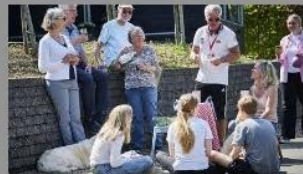
Naboven: Flere nabohjælpere