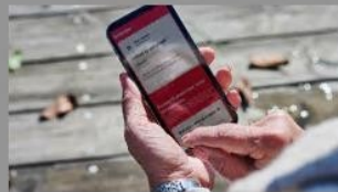
Naboven: Flere advarsler