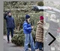
Naboven: Mere feriehjælp