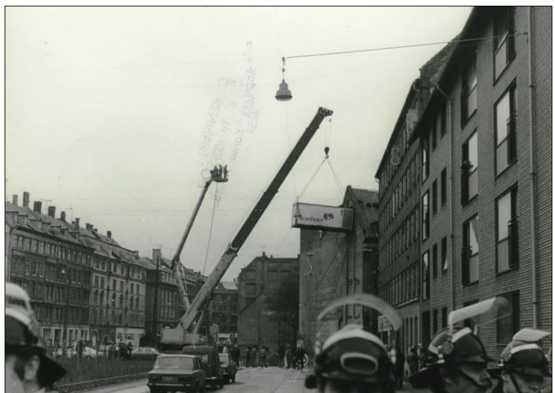
Her ses, hvorledes en container med politifolk hejses op i 3. sals højde. Betjentene gennembryder muren få minutter efter.

De unges tilbagetog bragte et smil frem på læberne og BZ-bevægelsen nød faktisk flere steder sympati i disse år. Så meget, at Københavns Kommune til sidst gav bevægelsen, hvad de ønskede sig – deres eget hus. Den 30. oktober 1982 tildeltes BZ-miljøet således ungdomshuset på den famøse adresse Jagtvej 69. Ved åbningen kvitterede BZ'erne uhøfligt ved