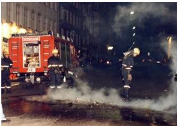
Brandmænd i færd med oprydning efter urolighederne