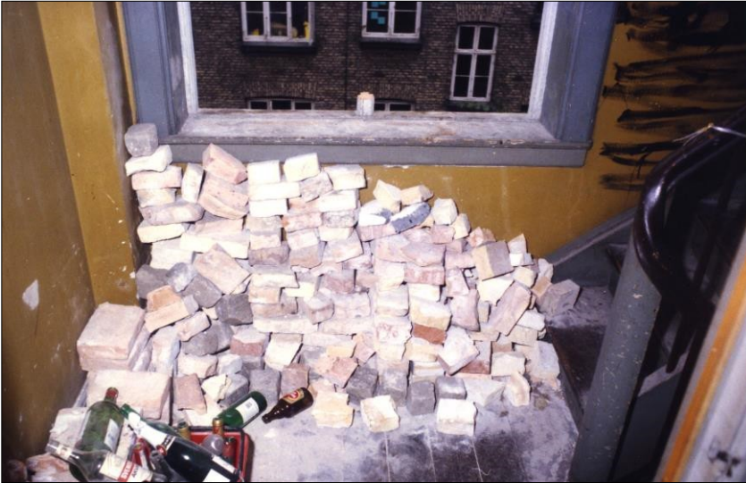
Mursten og flasker gjort parat som kasteskyts. Ryesgade nr. 58, Østerbro. København.

brosten og flasker. Ved en enkelt lejlighed kastede BZ'ere tilmed en toiletkumme ned fra en bygning, for at ramme de udsendte betjente. Politiet gik hårdt til værks i forsøget på rydning, og det kom til tider til voldsomme sammenstød. Når politiet endelig fik ryddet en besat ejendom, besatte de unge et nyt hus, og det hele kunne mere eller mindre gentage sig.