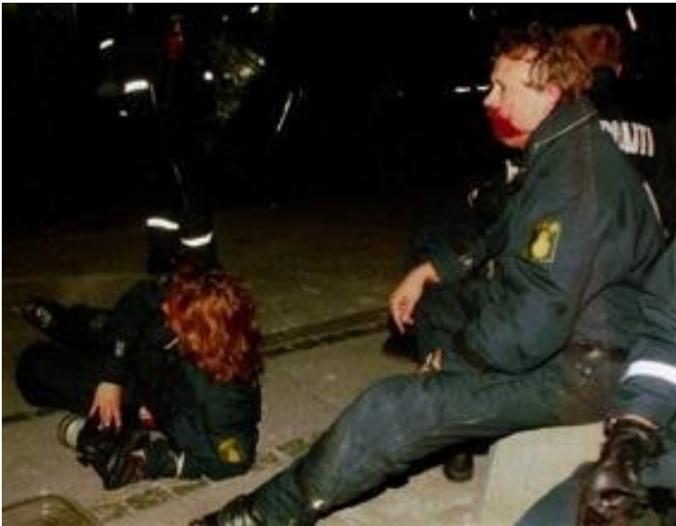
Betjente sårede af kasteskyts

Tæt ved Sankt Hans Torv befinder der sig ni civilklædte betjente. De bliver pludseligt opdaget af demonstranterne og melder over radioen; ”... så er vi angrebet midt på Fælledvej, så nu må der kraftknusemig komme hjælp frem”. KSN opfatter også fejlagtigt denne som en knibemelding. De ni betjente løber hurtigt i sikkerhed bag politikæden længere nede ad Fælledvej og melder til Leo Lerke, der fejlagtigt tror, at der stadigvæk befinder sig to civile betjente under angreb ved Sankt Hans Torv. Trods manglen på gas, føler han sig derfor nødsaget til at rykke frem. En deling betjente sendes op ad Fælledvej mod torvet i politikæde, marcherende i formation, side om side med skjoldet hævet op foran sig. Da delingen befinder sig ca. 50 meter fra torvet, kommer de inden for kasteafstand. De mange videooptagelser fra episoden viser, hvordan der pludseligt er en konstant regn af brosten i luften. Betjentene har aldrig oplevet